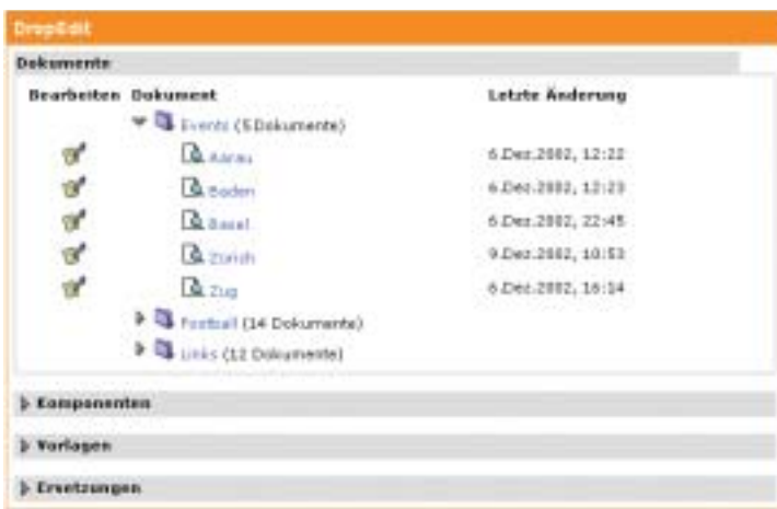
Verwaltung der Dokumente in DropEdit

...oder Sie entscheiden sich für DropEdit, dem genial einfachen Content Management System (CMS) von DropNet AG. Mit DropEdit gestalten Sie den Inhalt Ihrer Seiten selber, Text in allen Farben, Grössen und Schriftarten, Listen, Tabellen und Bilder. Selbstverständlich lassen sich auch multimediale Elemente, wie Filme und Flash-Animationen, einfach einbauen. Ihrer Fantasie sind kaum Grenzen gesetzt. DropEdit ist der Nachfolger vom "DropNet Editfeld", ist genau so einfach zu bedienen, bietet aber viel mehr Möglichkeiten.