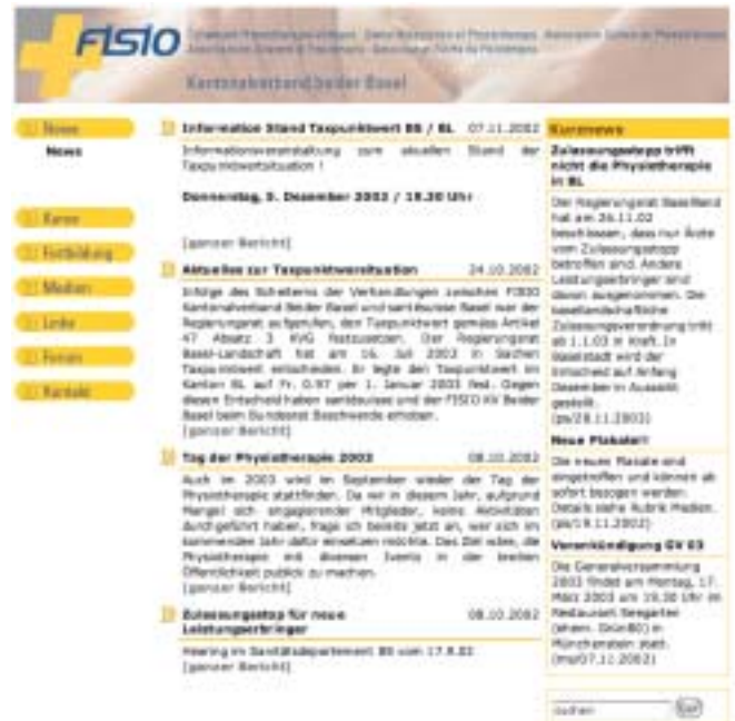
Auf dieser Seite findet man DropNews im Einsatz. Von den redaktionellen Beiträgen sehen wir in der Mitte den Titel, Lead und das Erstellungsdatum. Die Kurznachrichten rechts lassen sich sehr schnell ändern.

bereitstehen. Sie als Redaktor publizieren diese Beiträge oder geben ihnen ein Erscheinungs- und Enddatum. Alle Beiträge sind im Archiv weiterhin verfügbar. Selbstverständlich ist eine Suchmaschine