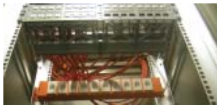
Der erste 19" Schrank frisch verdrahtet

DropNet AG baut die Hosting-Dienstleistung einerseits auf der Softwareseite aus und andererseits wird in neue Server und einen professionellen Serverraum investiert. Der neue Serverraum ist komplett in 19"-Technik aufgebaut, klimatisiert und die Server werden auch bei Stromausfall von der USV aufrecht erhalten. DropNet AG setzt selber Sun-Netra-Server ein, welche unter Solaris betrieben werden.